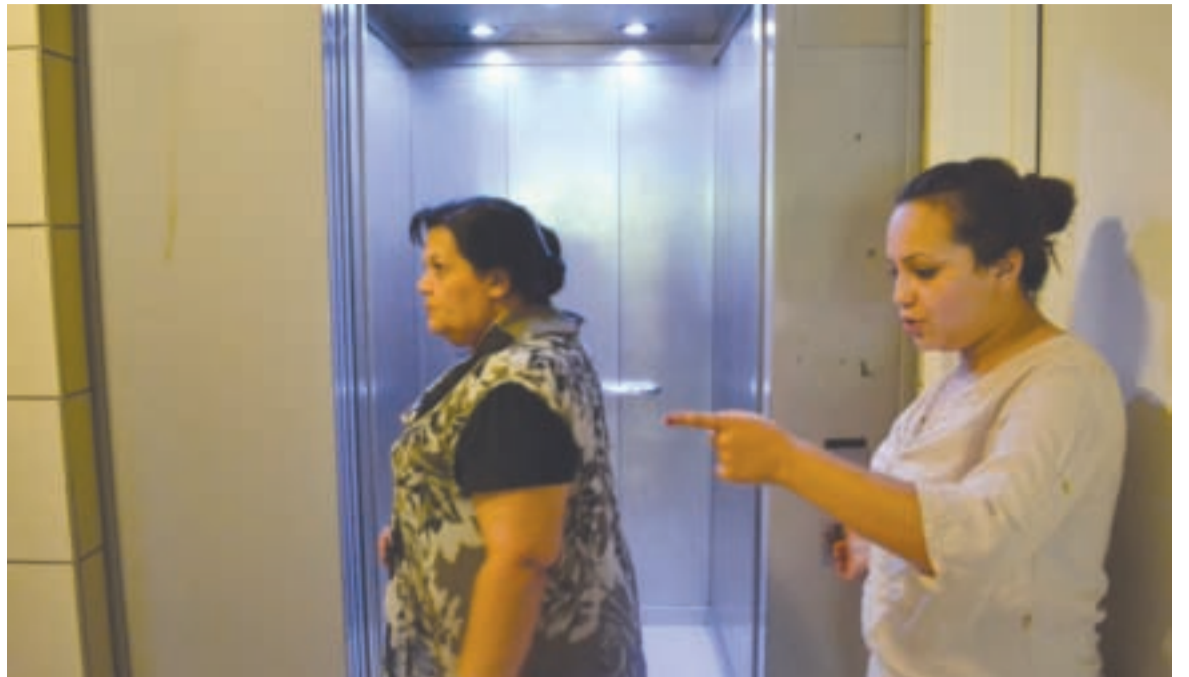
Face au silence de l'Opac, les locataires se sentent laissés-pour-compte.

est symptomatique d'autres problèmes qui touchent l'immeuble et l'ensemble du quartier. Les pannes de chauffage sont également récurrentes, malgré les factures qui tombent