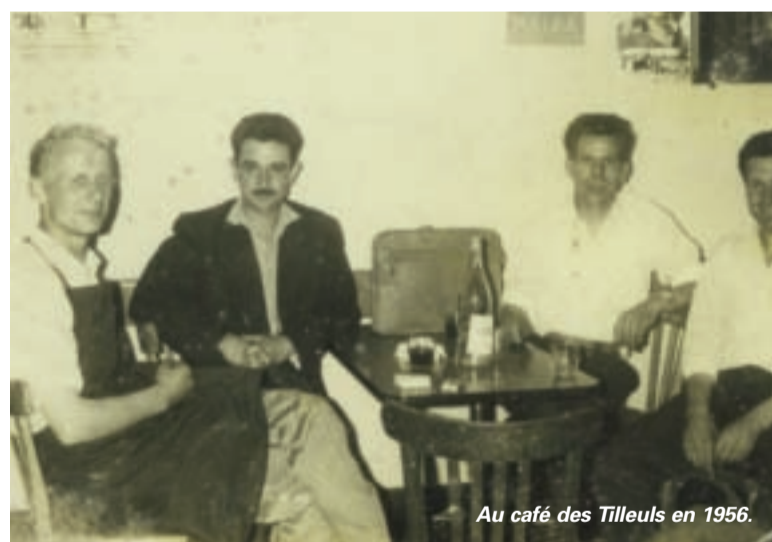
Au café des Tilleuls en 1956.