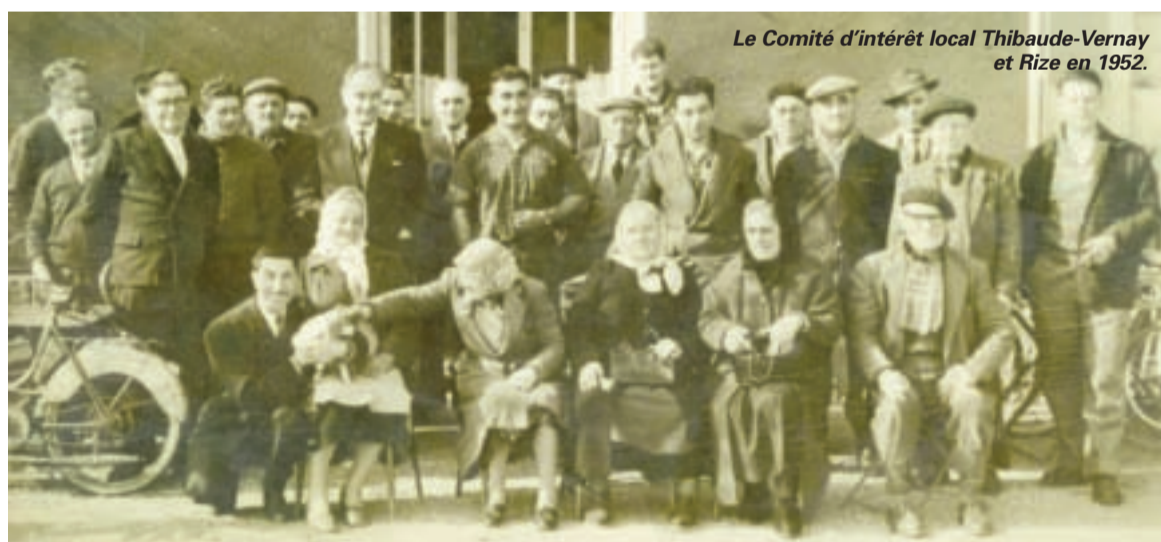
Le Comité d'intérêt local Thibaude-Vernay et Rize en 1952.