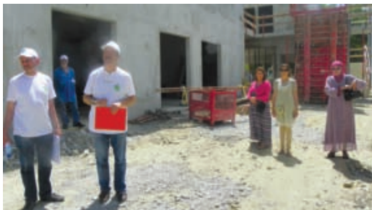
Les deux tiers du gros œuvre ont été réalisés, soit environ 30 % de l'ensemble des travaux de la mosquée Okba.

montant total du projet atteint cinq millions d'euros. Reste à trouver près de 800 000 euros pour achever le gros œuvre, terminer notamment le minaret, haut de 24 mètres et construire le bâtiment administratif. F.M www.mosqueevaulx.com